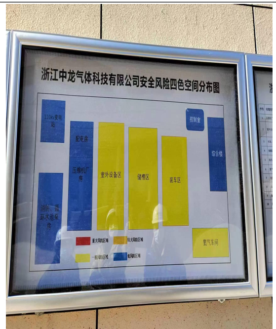
图 2 企业分布图