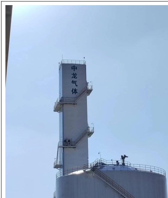
图 1 企业门牌信息