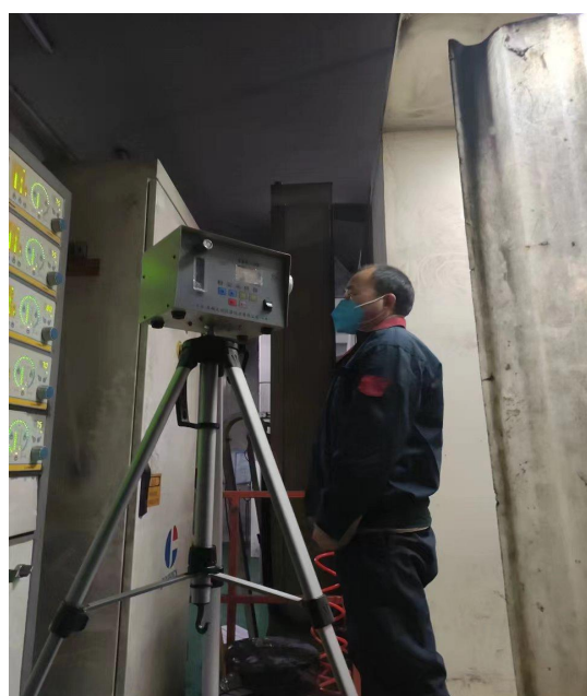
图 2 喷塑岗位