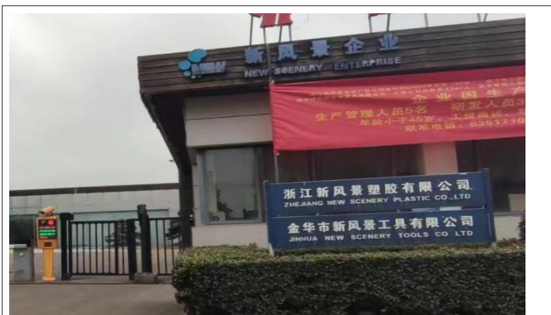
图 1 企业门牌信息